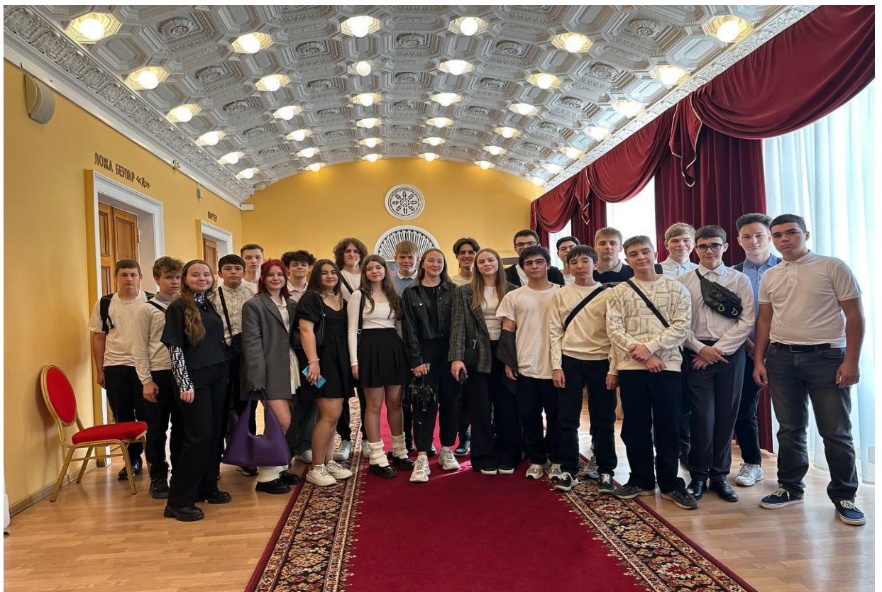
КТ МТУСИ спортивно-развлекательное мероприятие «Головинский бутерброд - 2024», в парке «Усадьба Михалково» Головинского района. В рамках этого события